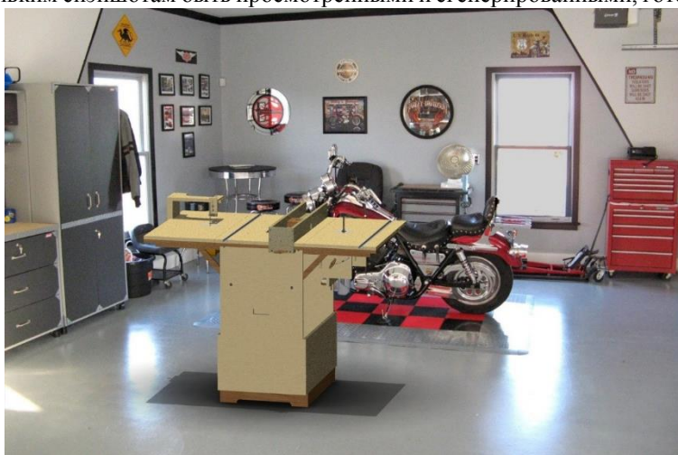
Рис.2. Фотореалистичное изображение мультифункционального верстака CompactWorkshop на одном из фонов

Приложение Artisan Rendering нацелено на создание процесса, позволяющего пользователям комбинировать материалы и освещение, до перемещения в конечную галерею качественных изображений. Так же с помощью данного программного обеспечения можно комбинировать фон и сцену и буквально в несколько кликов пройти путь от трехмерной модели до высококачественного изображения. Простота и скорость установки полной сцены (Снэпшота) – это основа приложения Artisan Rendering, позволяющего нескольким снэпшотам быть просмотренными и сгенерированными, готовыми