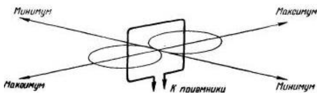
Рис. 2. Диаграмма направленности антенны

Рассмотрим направленные свойства данных антенн. Величина ЭДС, наведенной в антенне магнитным полем, зависит от ее положения в пространстве и максимума, когда плоскость витков направлена в сторону радиостанции. Если рамку поворачивать вокруг вертикальной оси, то за один полный оборот амплитуда наведенной в ней ЭДС дважды будет достигать наибольшего значения и дважды убывать почти до нуля (ДН «восьмерка») (рис. 2).